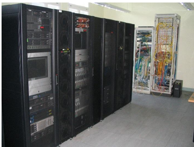
10. Szerverszoba a Sóházban