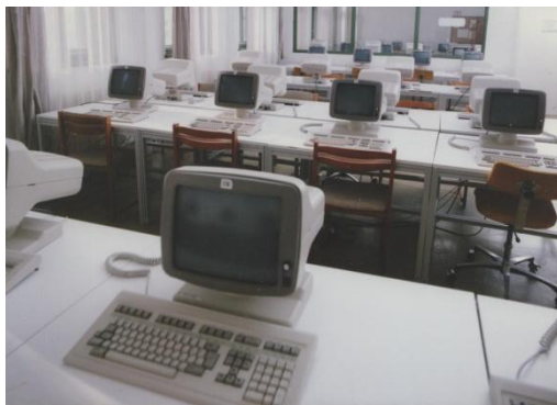
5. VT 16 termináletterem a Kinizsi utcában

Ekkorra azonban, a géptermi rész még nem volt kész, így az IBM3780 mellé került felállításra egy „szűkített” konfiguráció. 1984 novemberébe a VT600 és az egy időközben a Minisztérium által finanszírozott SZM4 típusú miniszámítógép végleges helyükre kerültek az eredetileg tervezett gépterembe. A hallgatók jelentős része továbbra is csak a kötegelt feldolgozást vehette igénybe, most már a VT600-ason, ennek eredményeképpen a fordulási idő néhány órára csökkent. Ugyanakkor már lehetőség nyílt arra, hogy elsősorban felsőbb éves hallgatók közül 8-10 fő képernyős terminálon dolgozhasson. Amikor, később sikerült mind a 32 terminált beszerezni, az alapképzésben résztvevő valamennyi hallgató számára lehetővé vált az on-line géphasználat, sajnos csak úgy, hogy egy-egy terminál mellett két-két hallgató ült.