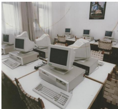
7. PC terem a Kinizsi utcában

A nyolcvanas évek második felében, az egyetem tanszékei jelentős számban kezdtek AT alapú számítógépeket beszerezni. A forrást különböző pályázatok biztosították. Ezek elsősorban kutatási pénzek voltak, a szellemi munkához lehetett személyi számítógépeket beszerezni. Mindez egyetemi szintű fejlesztési koncepció nélkül, az éppen aktuális igények által vezérelve történt. Ugyanakkor megkezdődött az egyetemi adminisztráció munkatársainak személyi számítógépekkel való ellátása is. Mindez lassan szükségessé tette a belső hálózat építésének elindítását, először a Kinizsi utcai épületben, majd a Főépületben. Az elérhető, és megfizethető technológia felhasználásával különböző, egymástól függetlenül működő, lokális Novell hálózatok (LAN-ok) jöttek létre. A Kinizsi utcai hálózaton hallgatók is tudtak már dolgozni.