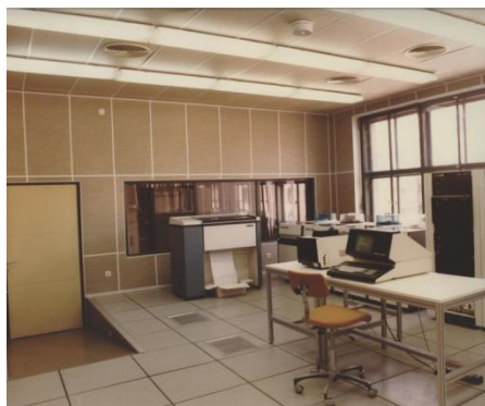
4. A VT600 gépterem részlete