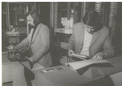
3. Az IBM 3780-nál

Az IBM Support Center IBM 360-as számítógépe a Kun Béla téri SZÜV gépteremben, majd rövid ideig Szentendrén működött. Végül a Szugló utcában felépült SZÜV székház első emeletén kapott helyet egy 370/145-ös gép. Ezekre a helyekre már zömmel közvetlen telefonvonalon keresztül történt a kommunikáció, meglepően alacsony számú vonalhibával.