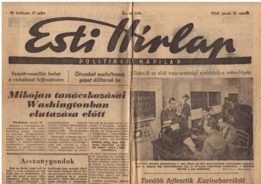
Az Esti Hírlap ma 60 éves címlapja

Pontosan hatvan évvel ezelőtt, 1959. január 21-én számolt be az Esti Hírlap az első magyar elektronikus számítógép (korabeli szóhasználat: „számológép”), az M-3 elkészültéről. Ez igazán kerek évforduló, a magyar informatika születésnapja . Az ünnepelt gép közel tíz évig működött, Budapesten, majd Szegeden, ahol végül 1968-ban leselejtezték. A magyar technikatörténet unikális értékét nem tudjuk teljes egészében bemutatni, de fontos darabjai láthatóak a Neumann János Számítógép-tudományi Társaság (link is external) Informatika Történeti Kiállításában – további darabjai pedig a Magyar Műszaki és Közlekedési Múzeum Műszaki Tanulmánytárában (link is external) . A gép leírása, műszaki adatai, története jól feldolgozott az NJSZT Informatikatörténeti Adattárában (link is external) is.