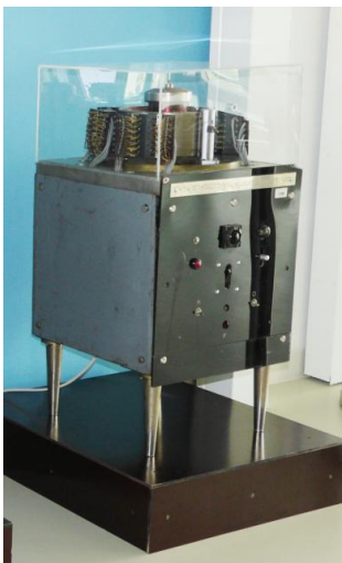
Modernizált mágnedob az NJSZT ITK-ban

Valójában január 21-e egy szimbolikus dátum csak. Az újságírónak elmondták, hogy a gép 30 műveletet végez másodpercenként, de ezt a szerző nem érezte elég bombasztikusnak, átírta arra, hogy 100.000 műveletet óránként . Korábban előfordult, hogy az Akadémia egy jelentős bizottsága jött megnézni a masinát. „ Mondjanak két számot és a gép össze fogja szorozni. ” – mondta büszkén az igazgató. Dömlöki bepötyögte a két számot – és nem történt semmi... Arra gondoltak, hogy a baj az lehetett, hogy az egyik szám 1526 volt. Ez volt a mohácsi vész számukra . Valószínűleg mire az újságíró megérkezett, a gép már ennél összefogottabb állapotban volt, de igazán megbízhatóan csak 1960-ban kezdett üzemelni.