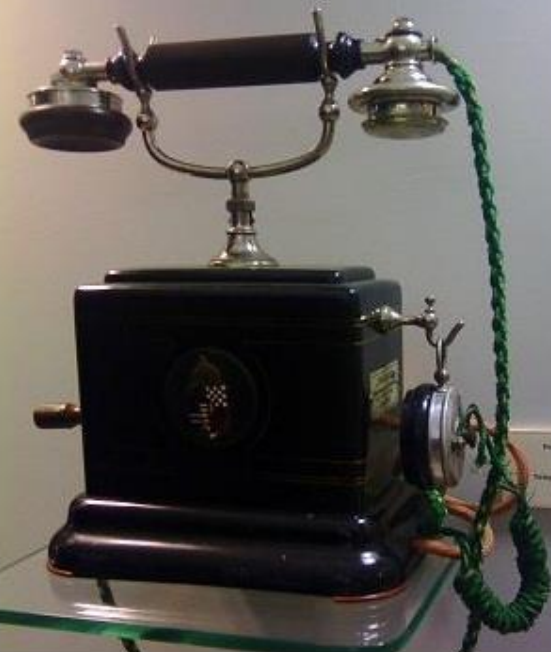
Ferenc józsef telefonja