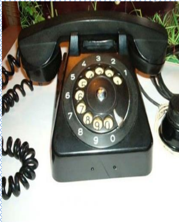
CB 555-ös telefon