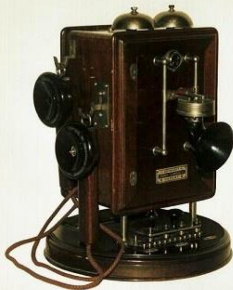
Az első magyar telefon