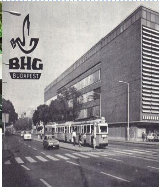
Fehérvári úti gyárépület