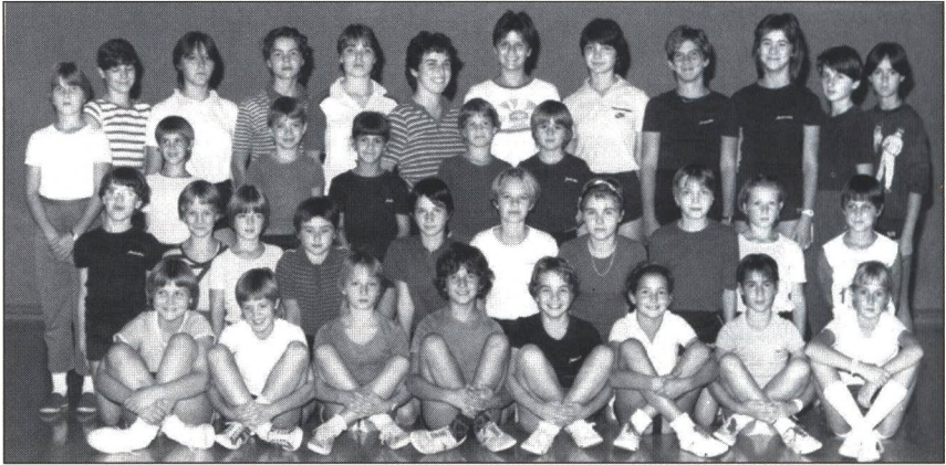
Az utánpótlás nevelésében Ormaiék mindig az élen jártak