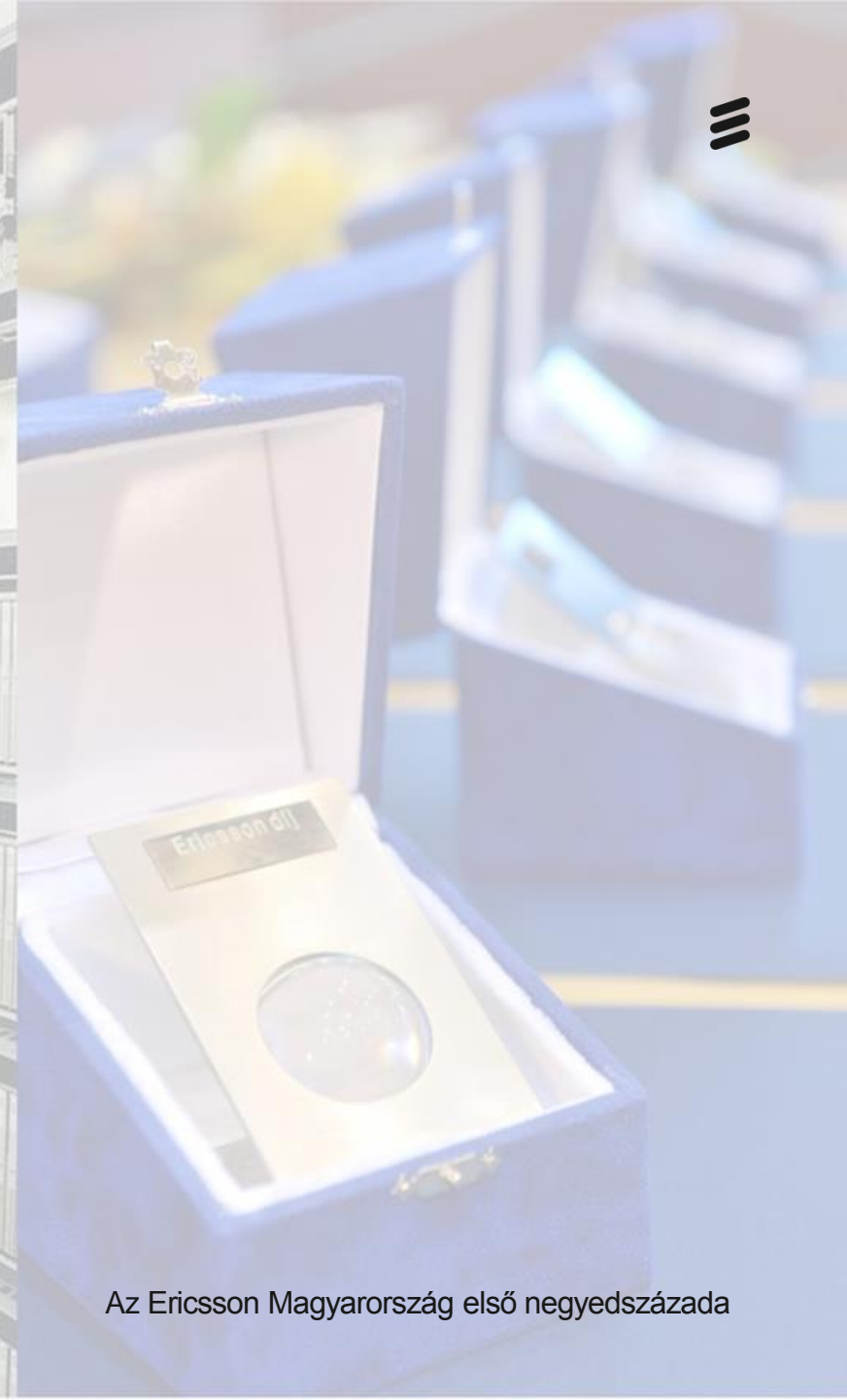
Az Ericsson Magyarország első negyedszázada