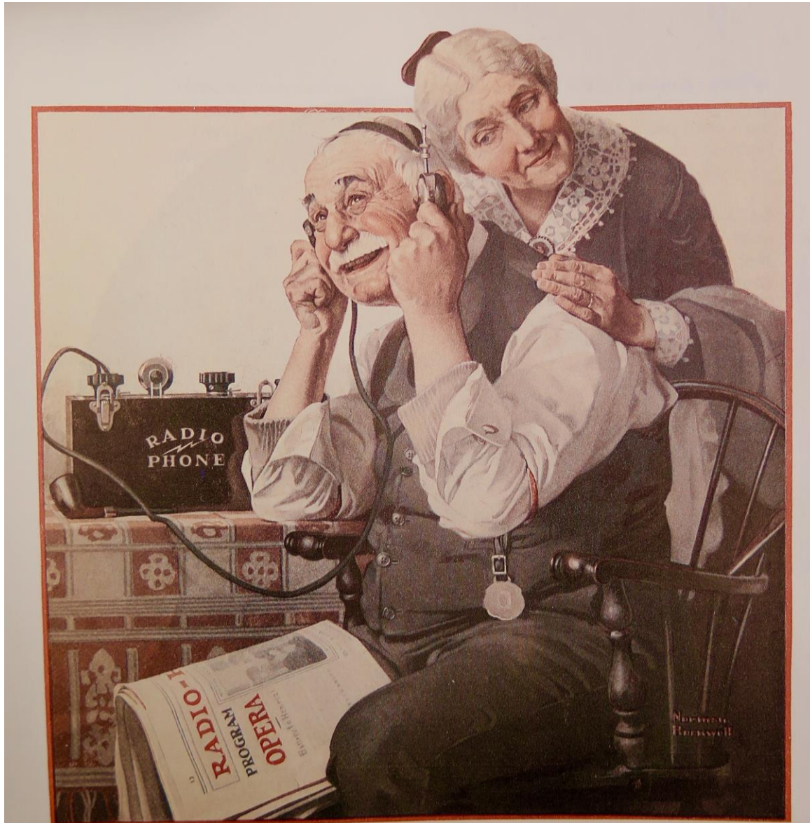
Old Couple Listening to Radio (1922)